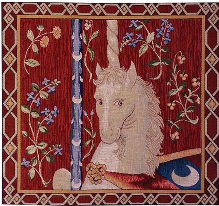
La Voie des contes en Bretagne