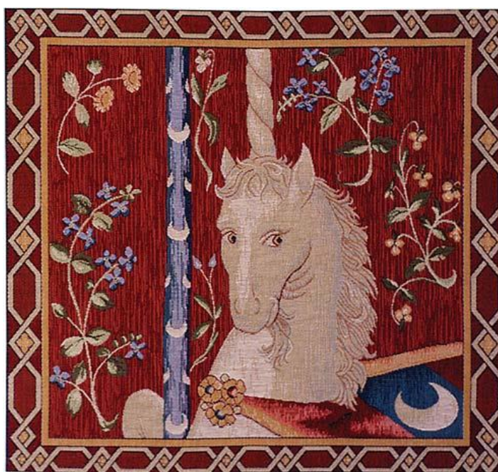
La Voie des contes en Bretagne