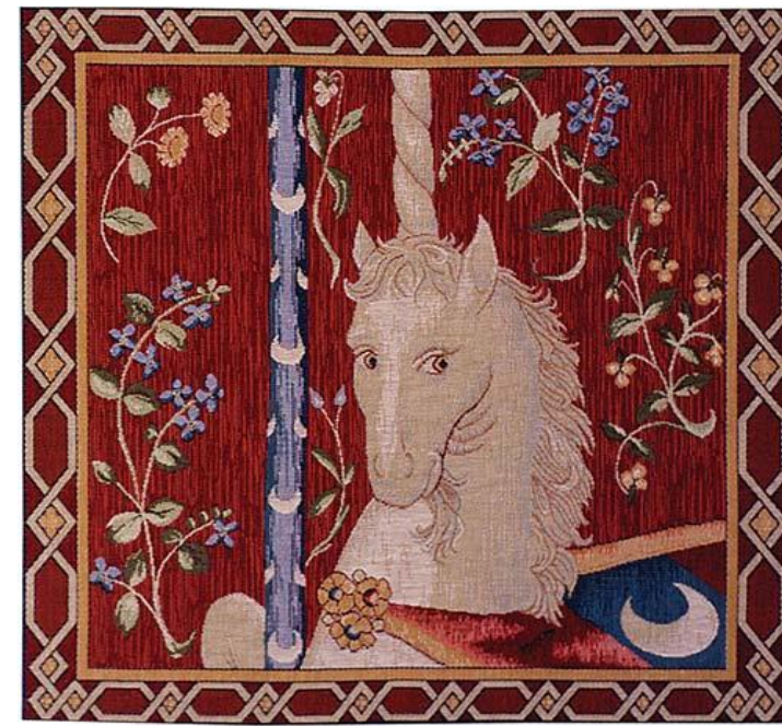
La Voie des contes en Bretagne